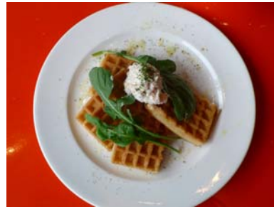
クリームチーズと野菜を使ったワッフル

具材例 季節の果物、キャラメルソース、クリームチーズ、はちみつ、ベリーソース、などを予定