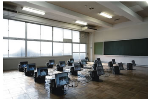
藤井光 chapter1 2005年