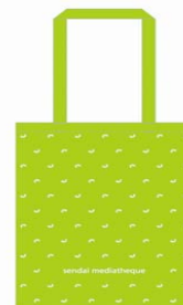
smt ロゴをモチーフにしたエコバッグ 800円(税込)