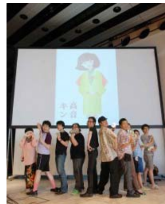
キャラクター高音キンと せんだいめでいあヲどり友の会 (プロジェクト参加者)