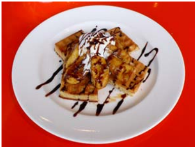
カラメルバナナとチョコソースのワッフル

館内1階のクレスキュールカフェにて、期間限定の開館10周年特別メニューを提供します。ベルギーワッフルに10種類の具材を用意、その中からお好きな2種類を選んでいただけます。幾通りもの組み合わせの中から、お好みの味をお楽しみください。