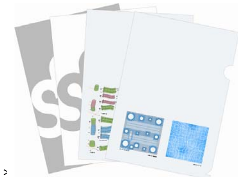
建物をモチーフにしたクリアファイル 各300円(税込)